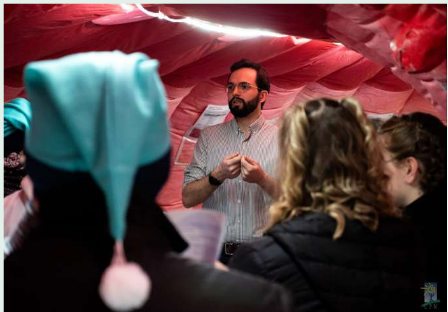
Colon Tour, 9 mars 2023

« Certaines formes de cancer sont liées à la présence dans le programme génétique de la personne, d'une anomalie transmissible à sa descendance. L'oncogénétique est au service de tous ces patients. Assurée par un médecin généticien ou un conseiller en génétique, la consultation vise à reconstituer leur histoire personnelle, construire leur arbre généalogique et évaluer si un test génétique est nécessaire. Nous jouons parfois un rôle direct dans le traitement du patient, mais c'est surtout à titre préventif que nous agissons en identifiant les