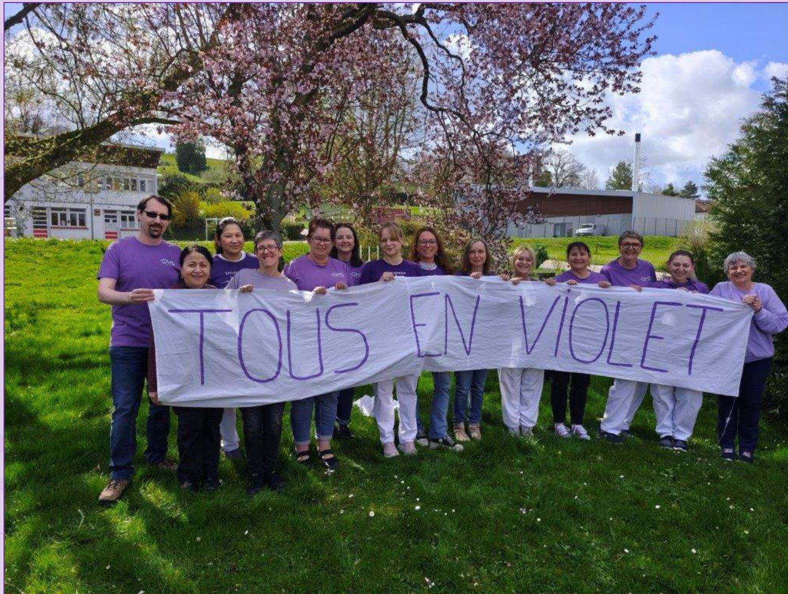
Equipe soignante du COCEE